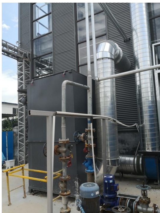
打磨工序布袋除尘器