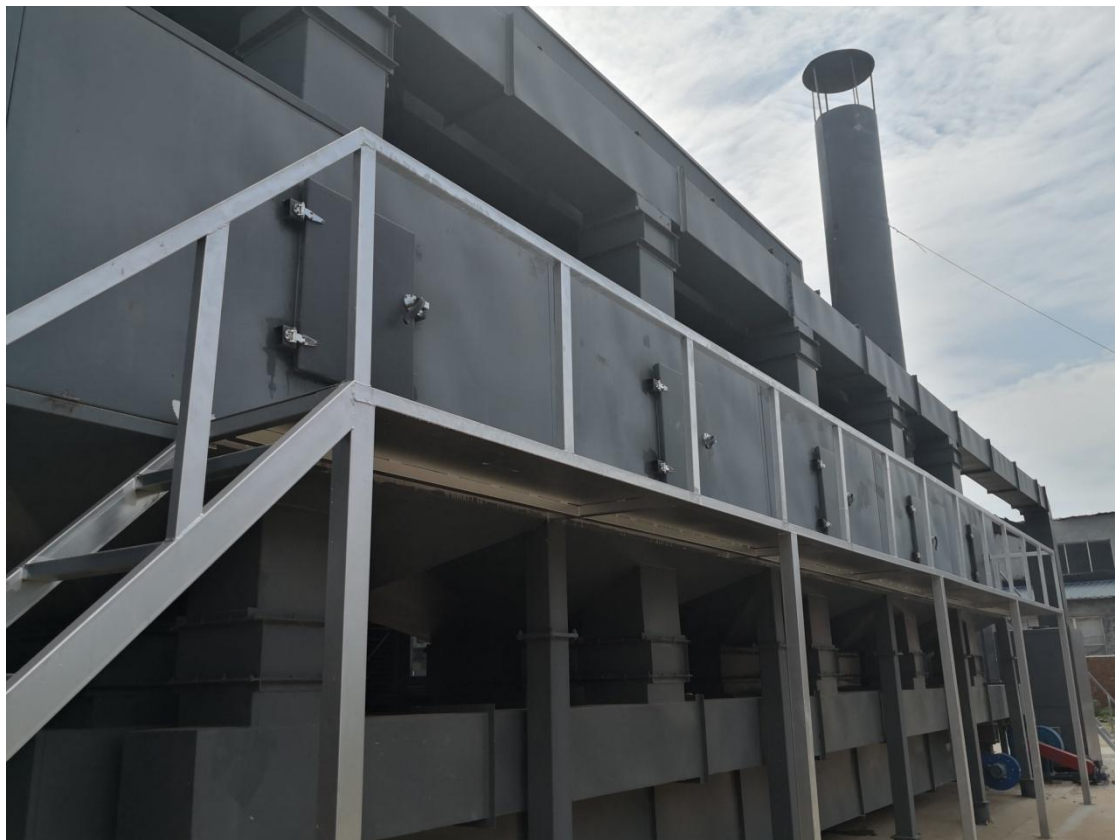
碱喷淋塔+过滤棉+活性炭吸附脱附+催化燃烧

粉碎工序产生的废气通过自带布袋除尘器处理后无组织排放；喷漆、烤漆、补漆、加热熔融、注塑开模工序未被收集的颗粒物、二甲苯、丙烯腈、1,3-丁二烯、苯乙烯、VOCs 无组织排放。