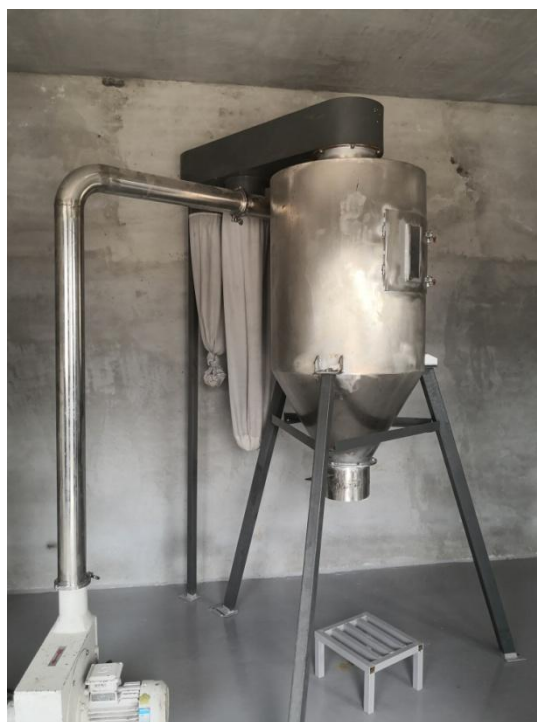
粉碎工序布袋除尘器